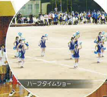
ハーフタイムショー